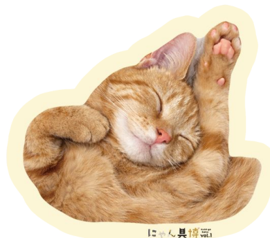
vol.1の特典 (オリジナルステッカー)