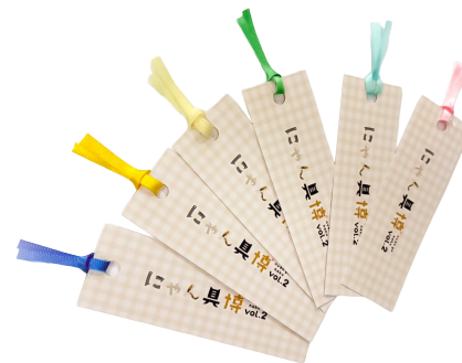
vol.2の特典 (オリジナル葉)